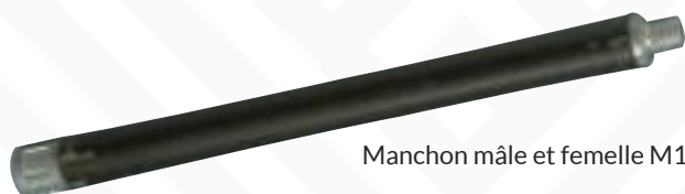
Manchon mâle et femelle M12